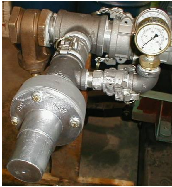
Figure 5: configuration d'essai #4

Connectez la soupape de contrôle de pression sur l'installation de test. La soupape de contrôle de pression devrait être installée de façon horizontale et la voie d'échappement positionnée de façon sécuritaire. Vissez la soupape de contrôle en place à la main et serrez-la avec une clé à molette (ou semblable) sur les parties hexagonales.