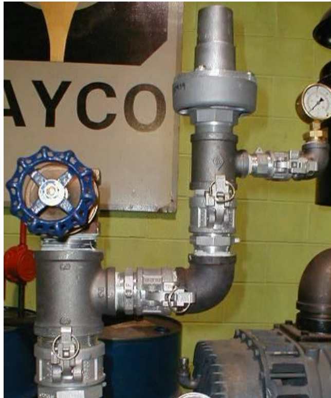
Figure 2: configuration d'essai #1 (configuration préférée)

Connectez la soupape de contrôle de pression sur l'installation de test. La soupape de contrôle de pression devrait être installée de façon verticale et la voie d'échappement positionnée de façon sécuritaire. Vissez la soupape de contrôle en place à la main et serrez-la avec une clé à molette (ou semblable) sur les parties hexagonales.