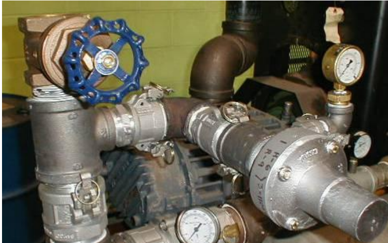
Figure 3: configuration d'essai #2

Connectez la soupape de contrôle de pression sur l'installation de test. La soupape de contrôle de pression devrait être installée de façon horizontale et la voie d'échappement positionnée de façon sécuritaire. Vissez la soupape de contrôle en place à la main et serrez-la avec une clé à molette (ou semblable) sur les parties hexagonales.