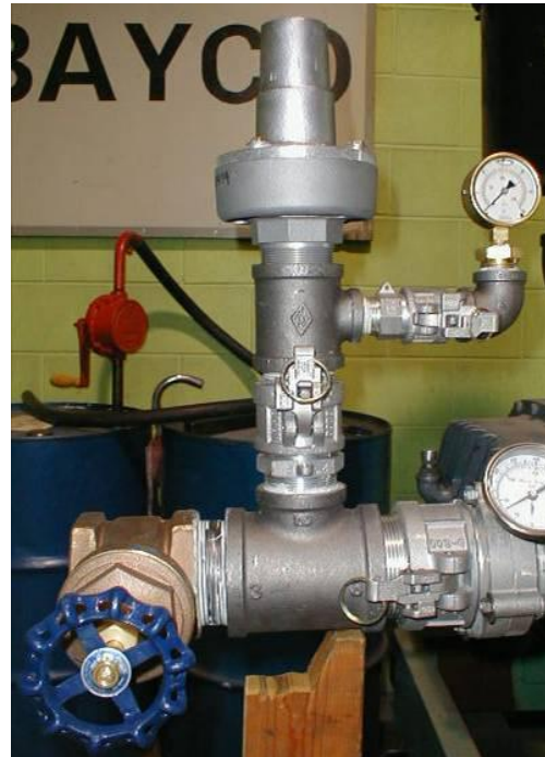
Figure 4: configuration d'essai #3

Connectez la soupape de contrôle de pression sur l'installation de test. La soupape de contrôle de pression devrait être installée de façon verticale et la voie d'échappement positionnée de façon sécuritaire. Vissez la soupape de contrôle en place à la main et serrez-la avec une clé à molette (ou semblable) sur les parties hexagonales.